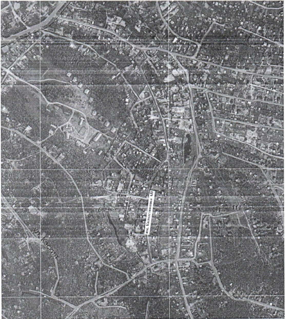
Схема улицы Арсения Колодезникова в г. Якутске

Заместитель главы - исполняющий обязанности руководителя аппарата