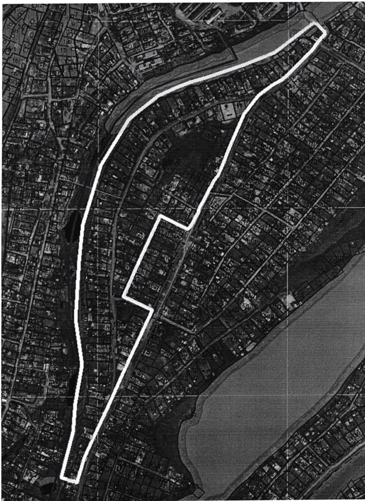
Схема границ ТОС «Стрелка-1»

лесного хозяйства Республики Саха (Якутия) и/или с Ленским бассейновым водным управлением.