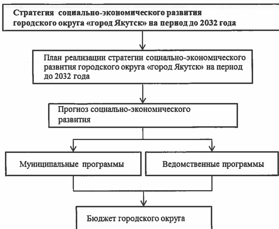
Рис.8.2.1. Состав основных элементов механизма реализации Стратегии

Основным инструментом механизма реализации Стратегии является совокупность муниципальных и ведомственных программ, на основе которой формируется бюджет городского округа «город Якутск» с соблюдением принципов программно-целевого управления социально-экономическим развитием: